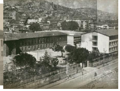
1972 Yılında öğretim binamızda tamamlandı

1947-1948 eğitim yılında okulumuzun adı Erkek Sanat Enstitüsü olarak değiştiriliyor ve okulumuz Enstitü düzeyine yükseltiliyor.