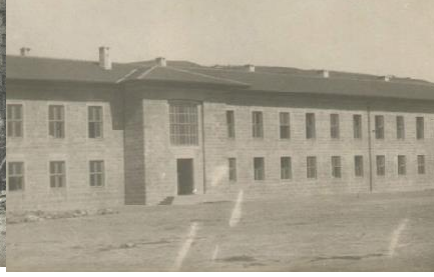
1947 Yılında taş bina tamamlandı